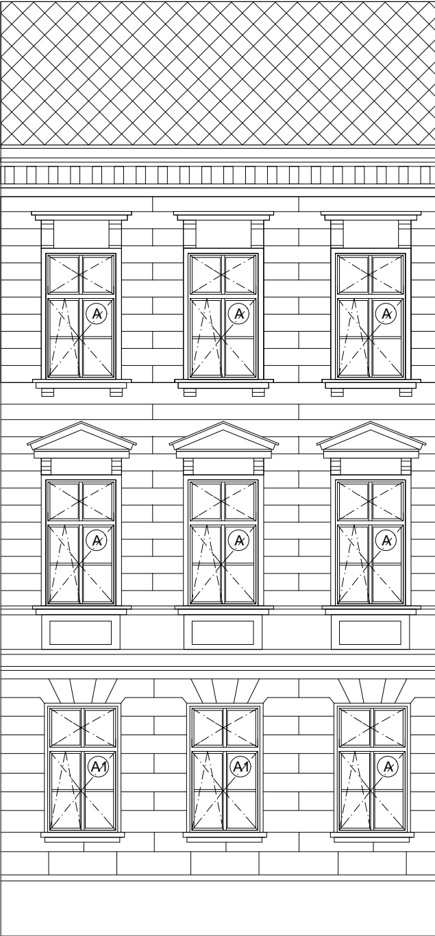
III. ETAPA / FASÁDA 4